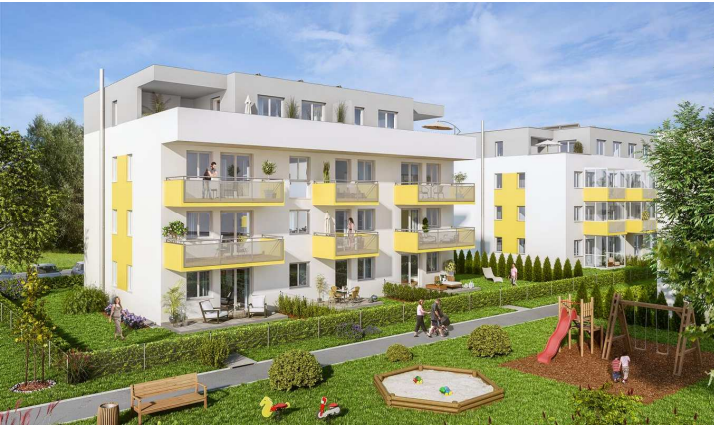
Wohnung Nr. B2/05/1.OG