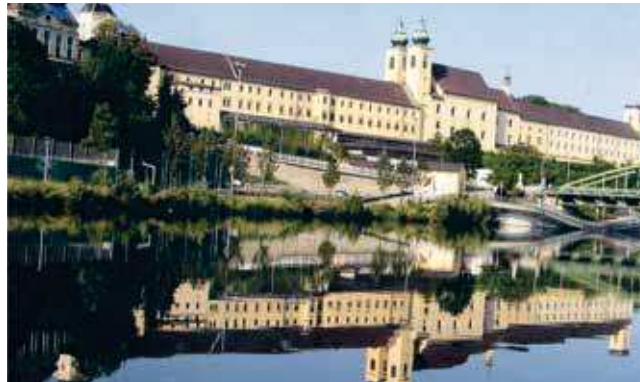
Von der Traun aus bietet sich ein traumhafter Ausblick auf das Stift

Genießen Sie lange Spaziergänge an der Traun – oder bummeln Sie einfach durch den Ort. Unter anderem bietet Lambach auch einige interessante Sehenswürdigkeiten an Sakral- und Profanbauten. „Lambach, das Tor zum Salzkammergut“ – eine Lebensgemeinde mit hochwertigen Angeboten in den Bereichen Wohnen, Gesundheit, Kultur, Freizeit und Bewegung.