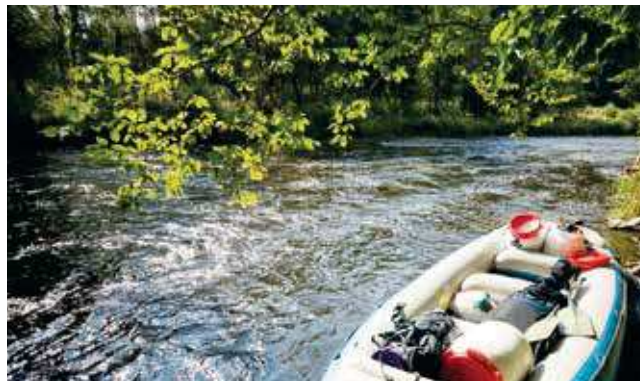
Lambachs Umgebung besitzt Biotope und Sumpfbiete an der Mündung der Ager in die Traun.