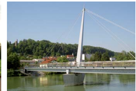
Eine Lebensgemeinde mit hochwertigen Angeboten in den Bereichen Wohnen, Gesundheit, Kultur, Freizeit und Bewegung...